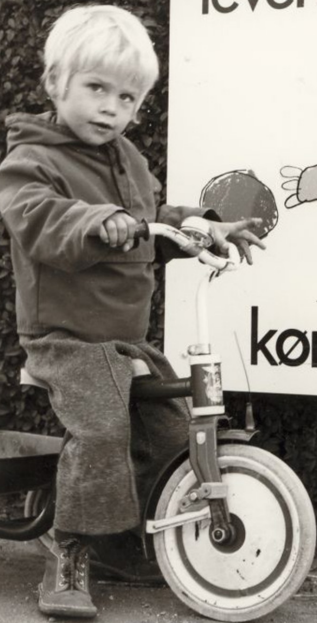
Dreng på trehjulet cykel foran vejskilt. Ukendt årstal