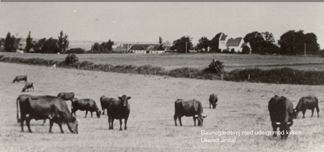
Baunegårdsvej med udsigt mod kirken. Ukendt årstal

Er du stadig i tvivl om hvorvidt dit materiale vil have interesse, så skriv til arkivet eller kontakt os inden for vores åbningstid.