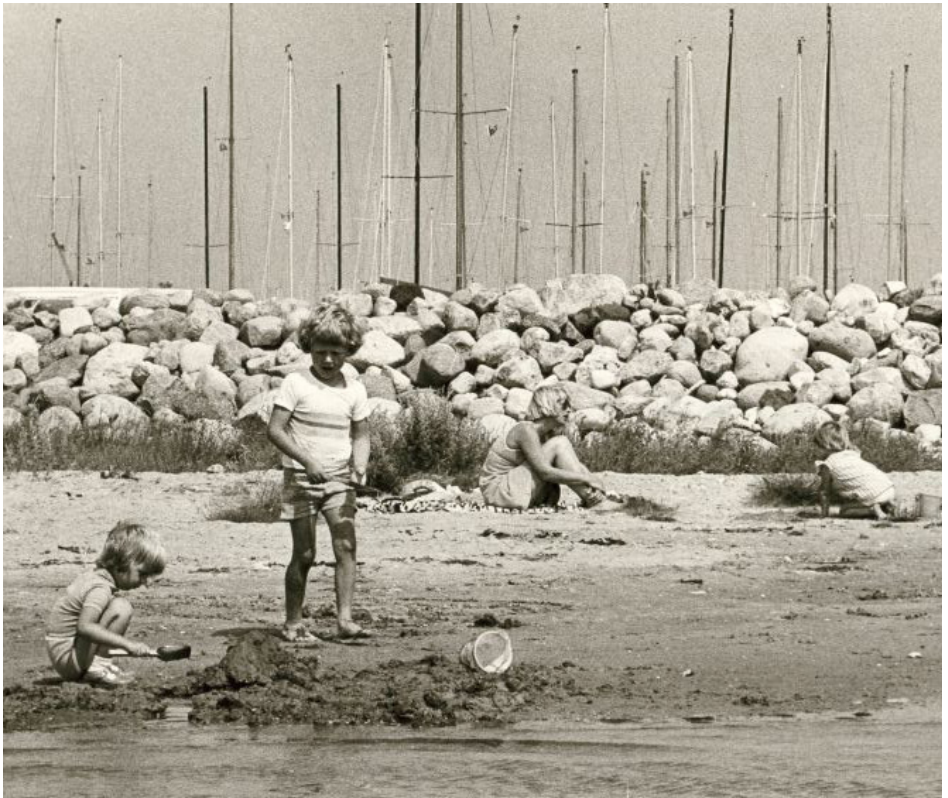
Børn leger på stranden ved Jyllinge Lystbådehavn i år 1976.