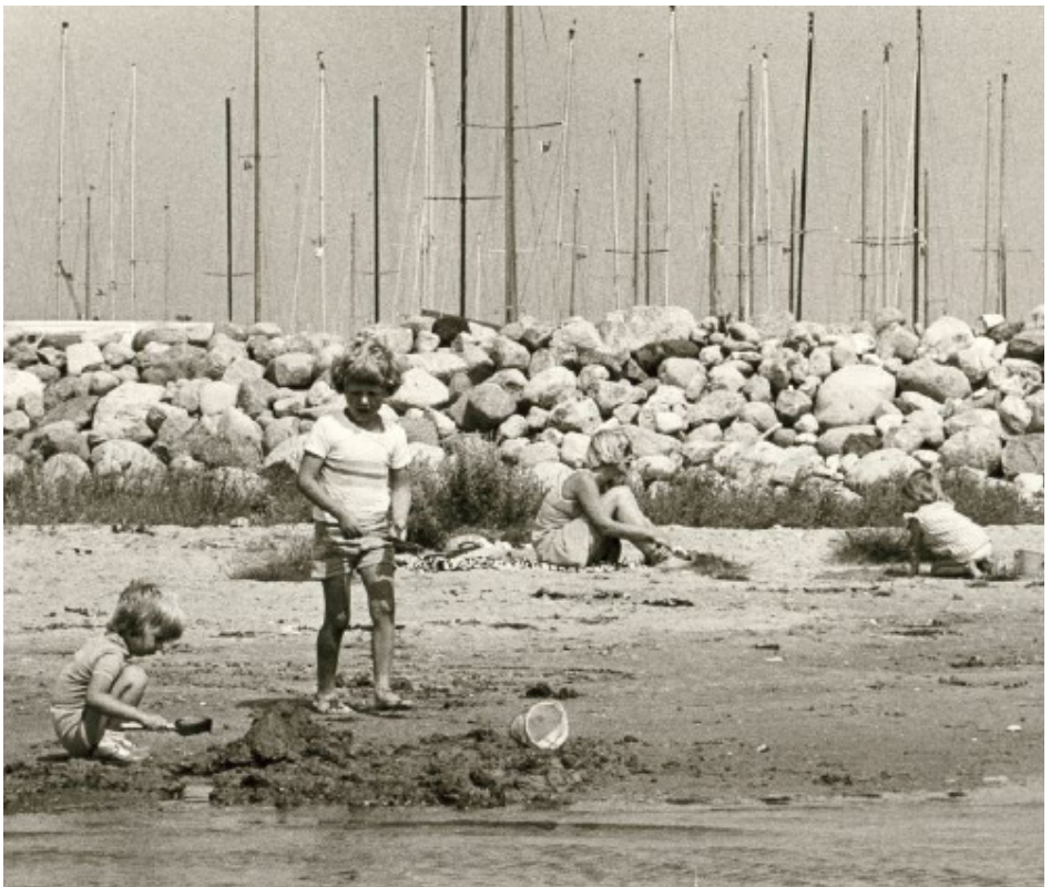
Børn leger på stranden ved Jyllinge Lystbådehavn i år 1976.